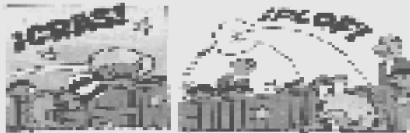
Onomatopeyas y líneas cinéticas