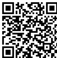
Código QR 2. Programa de las jornadas de Benicàssim