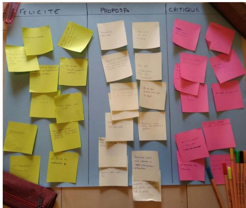
Ilustración 3 Felicito – Critico - Propongo

Dinámica de evaluación: Felicito – Critico - Propongo (Aguirre et al. 2018). En una cartulina se escriben en tres columnas Felicito – Critico - Propongo. El alumnado en post-its de tres colores diferentes escribe todo aquello que quiere felicitar del programa, las propuestas de mejora que considere y las críticas constructivas que aporten una mejora al programa. Una vez escritas, salen y las pegan en la columna apropiada mientras leen y explican aquello que han escrito. Una vez todo el alumnado ha realizado su aportación se realiza una reflexión final recogiendo todo lo comentado (20') (ver ilustración 3).