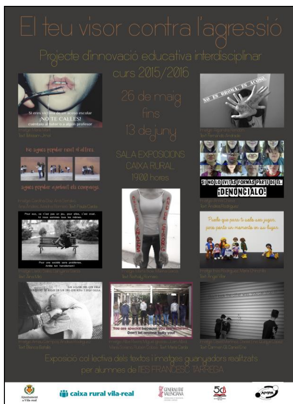
Fig.1: Cartel anunciador de la exposició