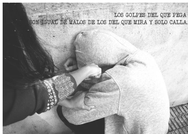
Fig. 2, 3 y 4: Algunos de los 10 carteles seleccionados