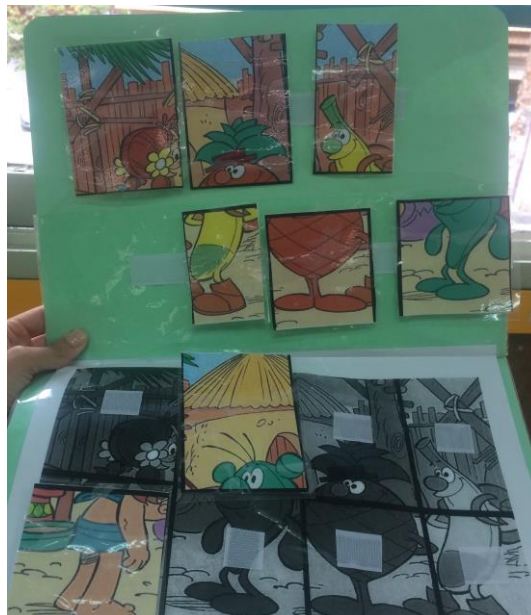
Figura 2. Material de elaboración propia

Pero, además de todo esto, es fundamental el material de elaboración propia ajustado a las características del alumnado que compone el aula (Figura 2), como por ejemplo el basado en el aprendizaje sin error, así como, el material individualizado según las necesidades de cada alumno.