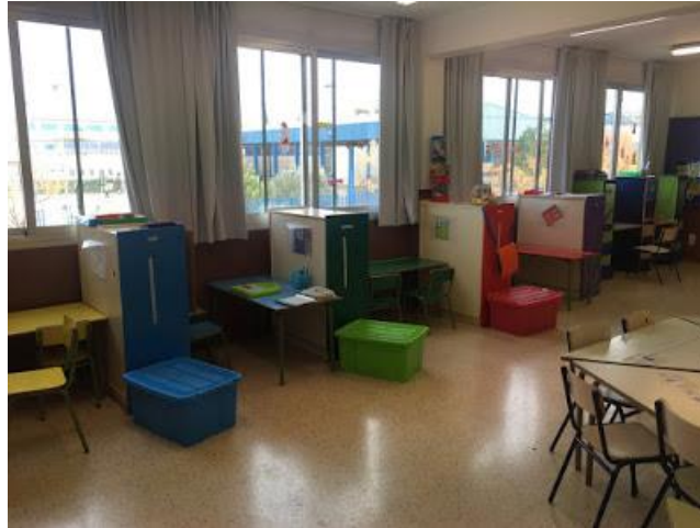
Figura 1. Organización del espacio

funcionamiento como estanterías, mesas, cajas... lo que favorece la organización del espacio (Figura 1).