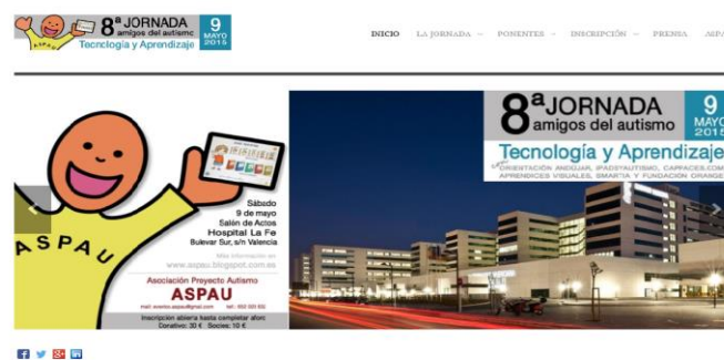
Figura 4. Cartel anunciador de la jornada "Amigos del autismo"

Aspau ofrece cursos de Terapias Naturales, Naturopatía, Respiración Holocópica, o Jornadas como "Amigos del autismo" (Figura 4).