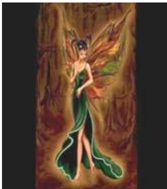
Imagen del personaje: