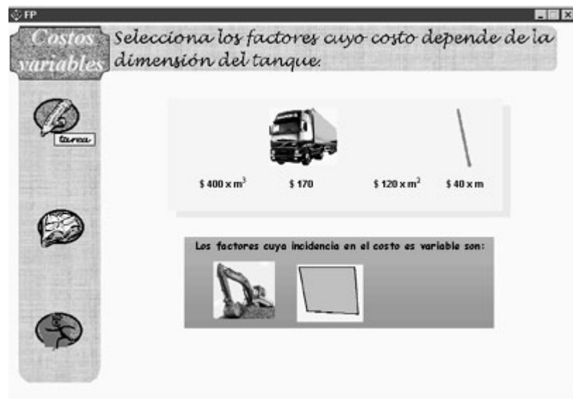
Figura 2: Áreas de la pantalla con funciones específicas.

La funcionalidad asignada a los botones que permiten acceder a información de referencia, adicional o ya presentada en una instancia anterior radica en activar una ventana auxiliar, de tamaño reducido y posicionada en el centro de la pantalla, que puede ser desplazada para no obstaculizar el desarrollo de la actividad. Cabe mencionar que la presencia, o no, de los botones es determinada por el contexto de trabajo, y además, al posicionar el ratón sobre cada botón se indica la función del mismo.